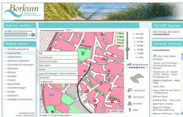
Insel Borkum borkum.kommunal-navigator.de

Auch dieses Projekt setzt auf dezentrale Datenverwaltung: Alle Landkreise und kreisfreien Städte Niedersachsens haben Zugriff auf das von NOLIS gelieferte CMS, die Zentralredaktion in Hannover koordiniert die Aktivitäten.